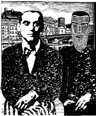
Nell'estate del 1936, 1985