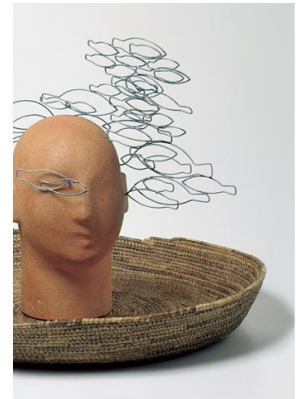
Phlebas il fenicio, 1997