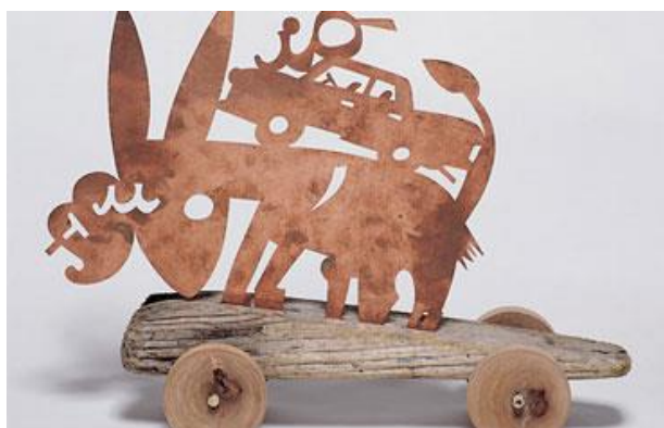
Asino io e tu, 2001