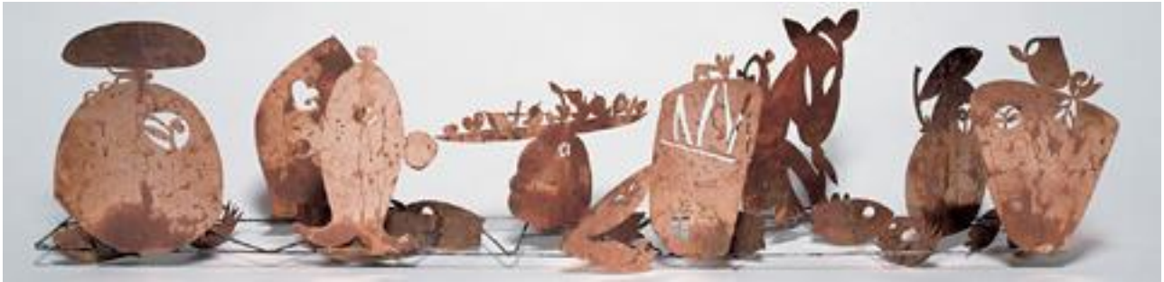
Les Demoiselles de Mamoiada, 2001

2000 - Villanova Monteleone, "Sos makines de Cuccu"